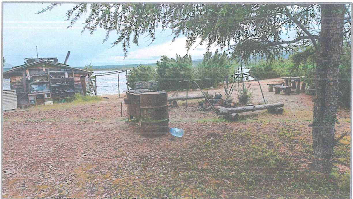
Фото 6. Туристская стоянка на косе Биологов. «Маршрут первопроходцев».