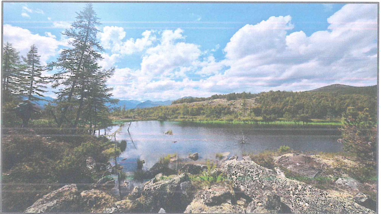
Фото 5. Одно из небольших моренных озёр. «Маршрут первопроходцев».