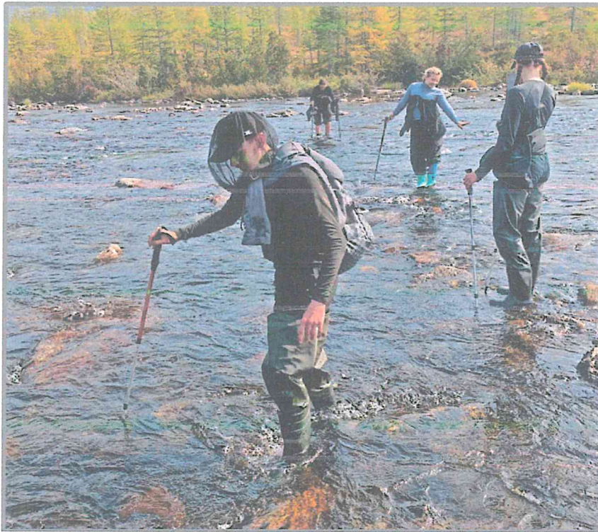
Фото 3. Переправа группы через протоку Вариантов. «Маршрут первопроходцев».