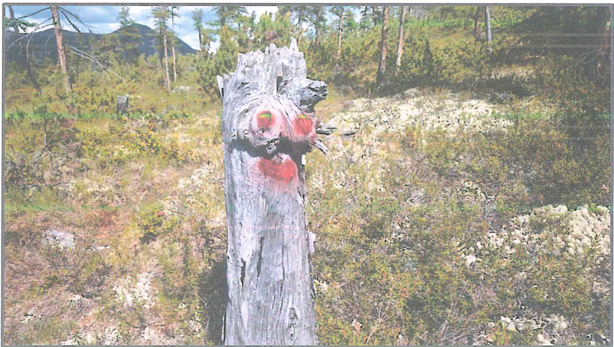
Фото 4. Элемент маркировки. «Маршрут первопроходцев».