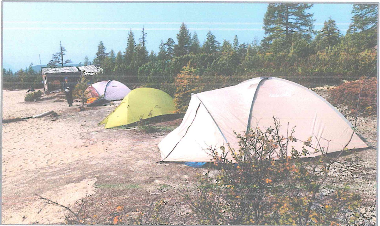
Фото 7. Туристская стоянка на косе Биологов. «Маршрут первопроходцев».