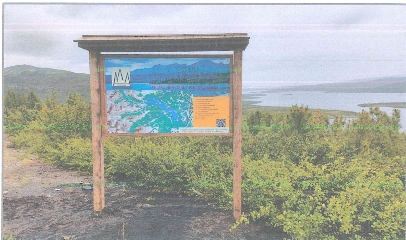
Фото 1. Начало маршрута. Вид на озеро Джека Лондона.