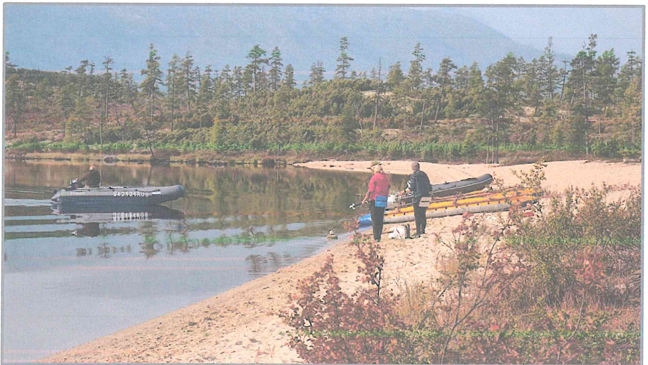
Фото 8. Коса Биологов. Конечная точка «Маршрута первопроходцев».